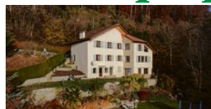
Montreux réf. 21-912-17

Maison de Maître de 12 pièces ▪ 1'600 m 2 terrain, vue imprenable ▪ En annexe: 3 1/2 pièces indépendant ▪ Fr. 3'650'000.- y compris 6 pl. parc