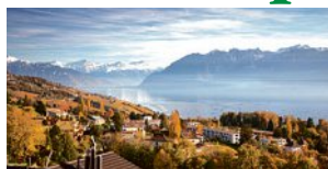
Belmont-sur-Lausanne réf. 22-101-01

Vue panoramique lac et Alpes ▪ Beau 4 1/2 pièces 145 m 2 hab. ▪ Quartier résidentiel ▪ Fr. 1'550'000.-