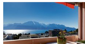
Montreux réf. 22-401-03

4 1/2 pièces 120 m 2 , 2 balcons ▪ Dernier étage, très belle vue lac ▪ Calme, 5 min. à pied de tout ▪ Fr. 1'090'000.- + garage