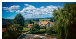
PenthaZ réf. 21-131-30

Superbe duplex 4 1/2 pces 120 m 2 ▪ Balcon 10 m 2 , luminosité naturelle ▪ Cadre calme et sans nuisance ▪ Fr. 920'000.- + 2 pl. parc